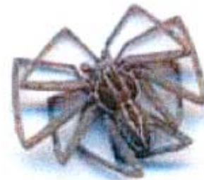
تهیه و تنظیم: مریم حکیمی

لازم به ذکر است رطیلها که دارای بدنی پرمو و درشت و شکمی کشیده و سیلندر مانند هستند فاقد غده سمی و دستگاه تزریق زهر می باشند. این جانوران در جلوی سر به جای نیش دارای آرواره های قوی هستند که برای شکار استفاده می شود و حتی توسط آن قادرند انسان را نیز مورد حمله و آسیب قرار دهند.