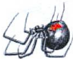
عنکبوت های سمی

دانشگاه علوم پزشکی و خدمات بهداشتی درمانی تهران دانشکده بهداشت و انستیتو تحقیقات بهداشتی گروه حشره شناسی پزشکی و مبارزه با ناقلین